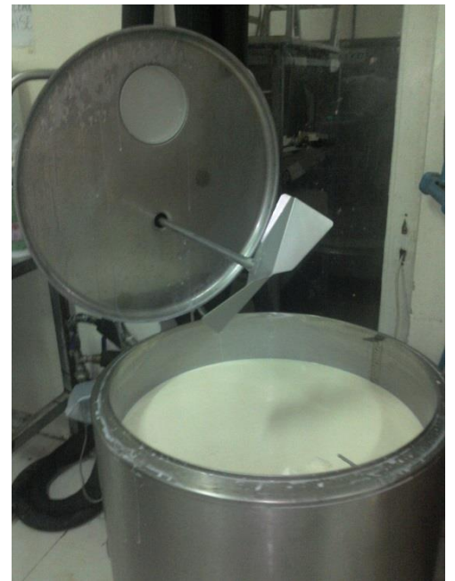
Tank à lait