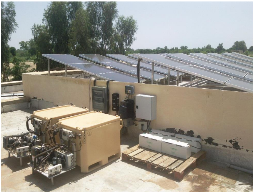
Installation du FROID SOLAIRE dans une ferme au Sénégal