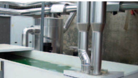
Bac de décantation d'une ligne de refroidissement