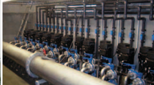
Refroidissement de lignes d'extrusion de plastique