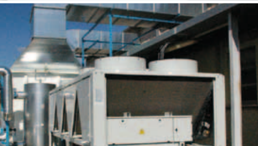
Groupe et caisson de traitement d'air