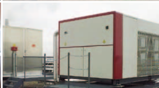
Chaufferie et groupe d'eau glacée en terrasse