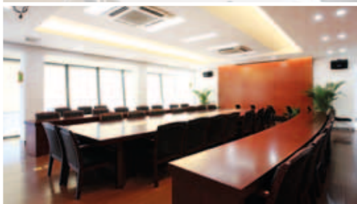
Cassettes encastrées en salle de réunion